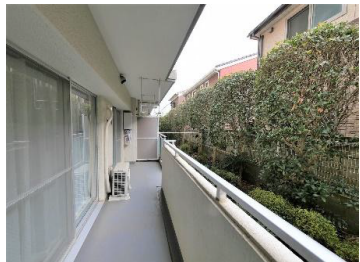
バルコニー 専用庭