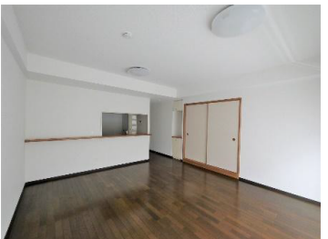
リビングダイニングキッチン

閑静な住宅街に位置する1階庭付南向きDK ~~~~~リフォーム工事内容~~~~~ (2023年1月工事完了) ・ユニットバス交換ガス給湯器交換(追い焚き有) ・洗面化粧台交換・レンジフード交換・ガスコンロ交換 ・トイレ交換カーペット張替(洋室1, 洋室2) ・全クロス張替・玄関床張替 ・洗濯用防水パン交換・エアコン1台設置)(・・・等